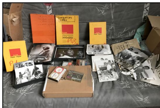
46 kg dans (100-80-30) cm