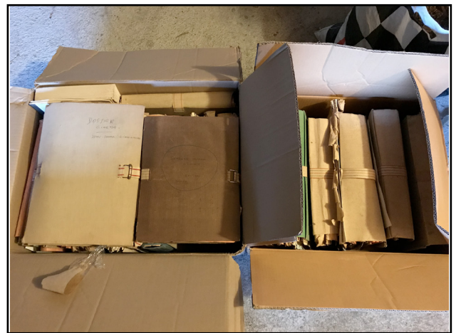
20 kg dans (43-56-30) cm et 31kg dans (53-43-26) cm