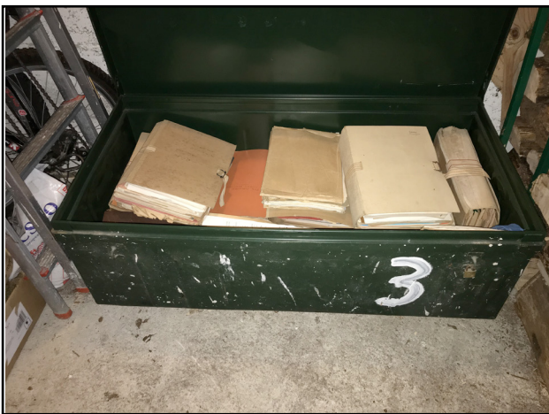
66 kg dans (55-108-39) cm