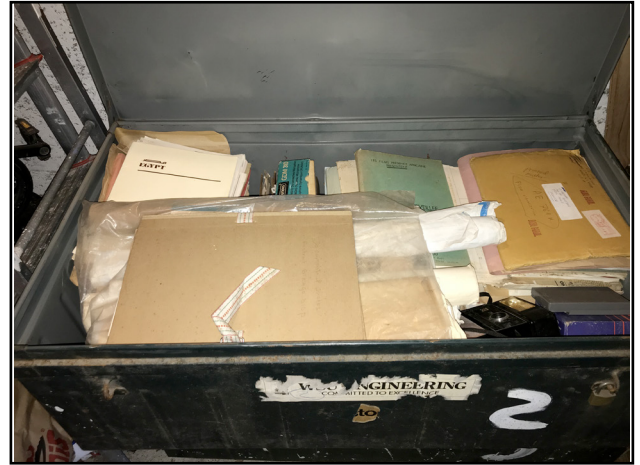
71 kg dans (54-97-37) cm